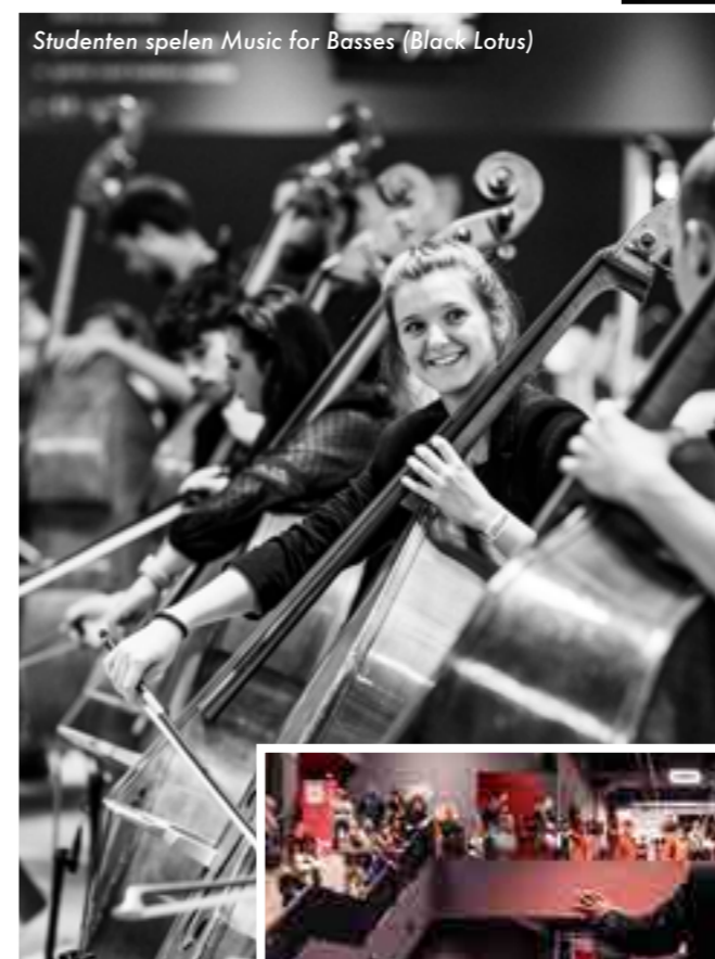
Studenten spelen Music for Basses (Black Lotus)