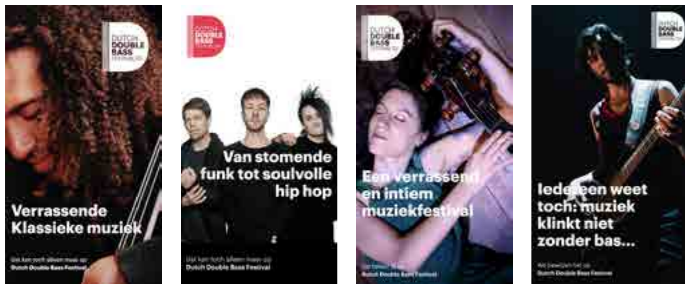
Een aantal van de (online) campagnebeelden voor DDBF '23

De vorig editie ingezette strategie met marketingbureau Walvis & Mosmans werd voor deze editie doorgezet: de doelstelling van DDBF door middel van een brede campagne aan een breed publiek over te brengen met daarin aandacht voor de verschillende doelgroepen. Door de brede programmering van het festival richten we de communicatie op liefhebbers van verschillende stijlen en willen we laten zien dat het niet een festival voor bassisten alleen is, maar voor alle muzikliefhebbers.