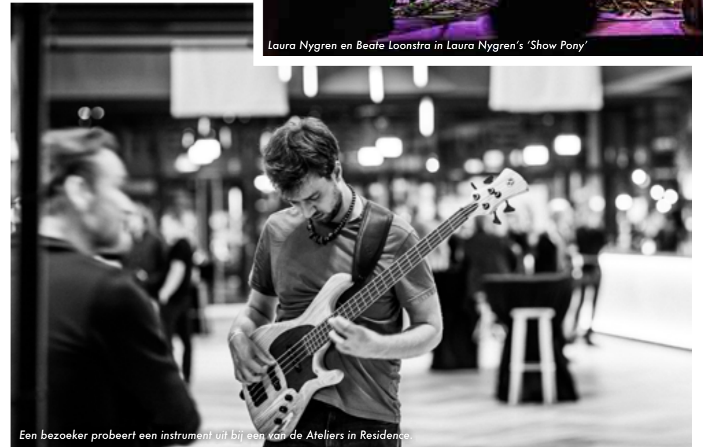
Een bezoeker probeert een instrument uit bij een van de Ateliers in Residence.