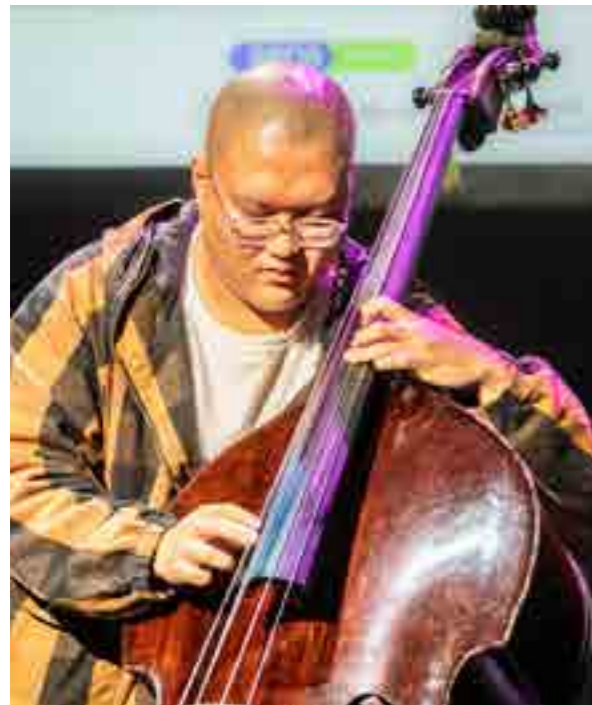
Een jazz student van CvA