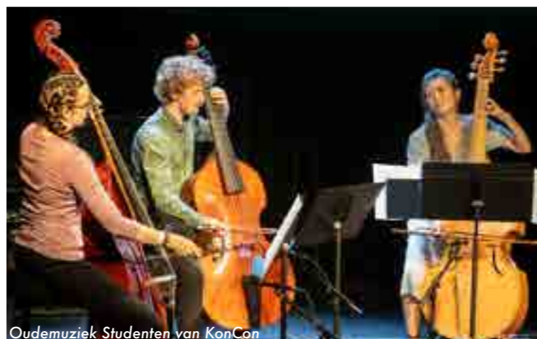
Oudemuziek Studenten van KonCon