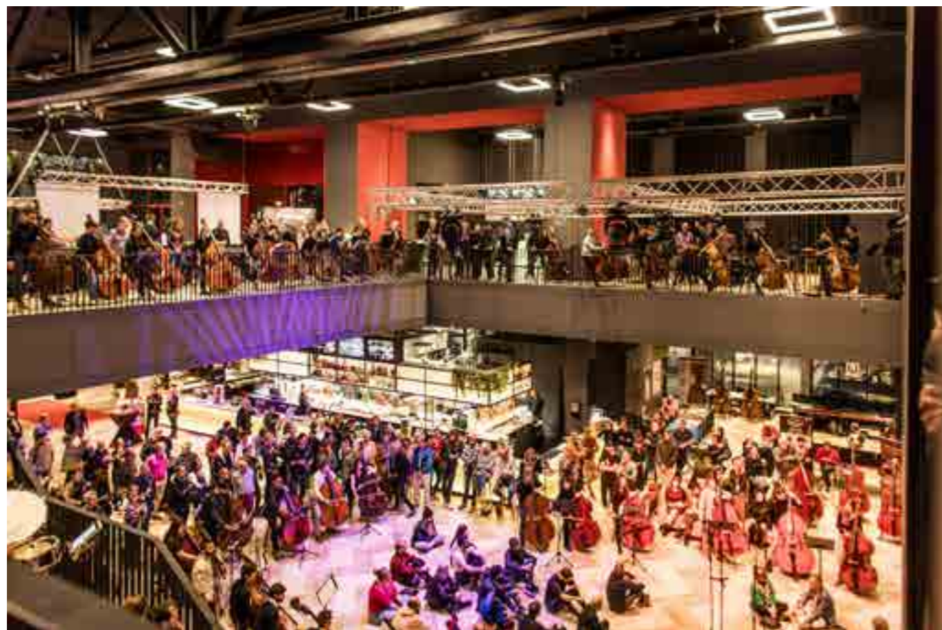
Theater Zuidplein tijdens Music for Basses (Black Lotus)

Stichting Dutch Double Bass Festival Oudezijds Achterburgwal 126 - E 1012DT Amsterdam robert.soomer@ddbfi.nl | james@jamesoesi.com KVK 66762472 | IBAN INGB 0007 4895 33